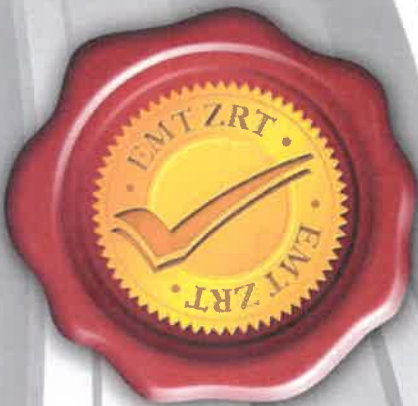
Bujtás Gyula vezérigazgató