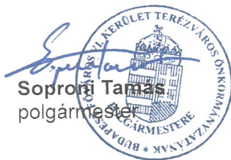
Soproni Tamás polgármester

A pályázatokat a beérkezéstől számított 60 napon belül bírálja el a képviselő-testület Városgazdálkodási és Pénzügyi Bizottsága.